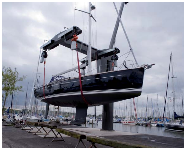
Hijsbanden voor botenlift